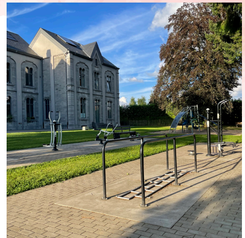
Aire de fitness MDA