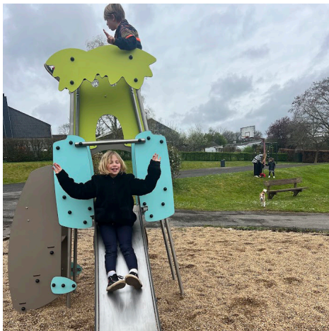
Plaine de jeux Chanly