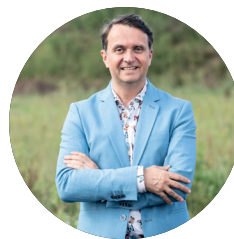
Benoît Closson Bourgmestre