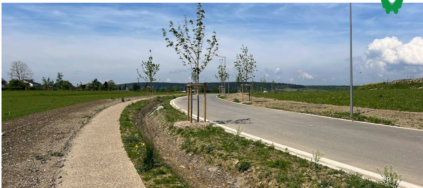
Photo extension PAE Wellin-Halma