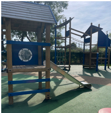
Plaine de jeux Lomprez