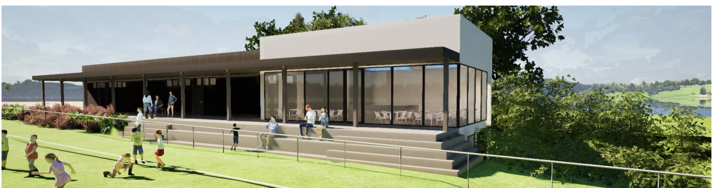
Photo 3D vestiaire buvette terrain B